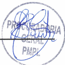
CRISTIANO ELIAS DOS REIS COSTA PREFEITO DO MUNICÍPIO DE PEDRO LEOPOLDO

Prefeitura de Pedro Leopoldo, 29 de julho de 2019.